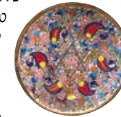
צלחת חרס מסביליה

מטעות הן המדינות המזמנות למבקרים מגוון כה רחב, כמו זה המצוי בספרד: יערות עבותים, פסגות הרים טרשיות, ערים סואנות שהתברכו באמנות ובאדריכלות נפלאות ורצועות אינסופיות של אתרי נופש לחוף-הים. כדי לבחור מותן