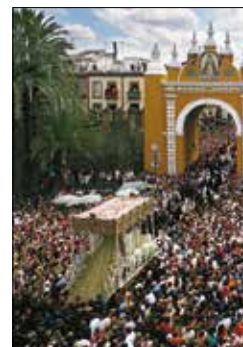
התלוכת מריה הקדושה במהלך השבוע הקדוש של הפסחא, סביליה

העיר הדרומית התוססת לגדות הנהר גואדאלקווייר משלבת בין הפאר הערבי לבין ספרד הנוצרית