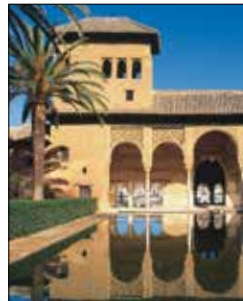
ארמון אלהמברה, גרנדה

– שילוב המתמזגה בקתדרלה ובמגדל הפעמונים שלה, לה חיראלכה (ראו עמ' 437-436), וכן בארמון המלוכה המפואר ריאל אלקארז (ראו עמ' 441-440). המבקרים נוהרים לסביליה גם בזכות האווירה הנפלאה, במיוחד ברחובות הלבנים של רובע סנטה קרוס, וכן בזירה למלחמות שוורים המפורסמת ביותר בספרד – טורוס דה לה מאסטראנסה (ראו עמ' 430). סביליה מלאת חיים עוד יותר מתמיד במהלך חגיגות סמאנה סנה (ראו עמ' 431), ויריד אפריל התוסס שבא בעקבותיהן, כשהעיר כולה רוגשת לצלילי הסביאנאס, הרגסה המקמית לפלמנקו.