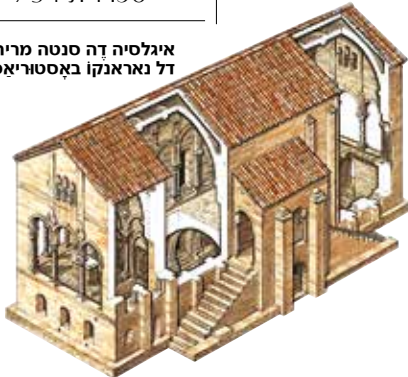
איגליסיה דה סנטה מריה דל נארנקו באֶסְטַרְיאָס