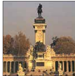
פסלו של אלפונסו ה-12, מדריד