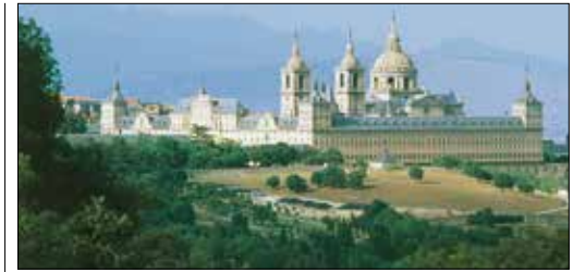
ארמון סן לורנסו דה אל אסקוריאל, נפת מדריד