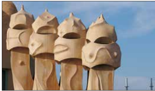
הארוכות המפוסלות של קאסה מילה ('לה פֶּדְרָה'), ברצלונה

לחבל הארץ הבטוח בעצמו יש אפילו שפה משלו, המדוברת מהפירנאים בצפון ועד לשדות האורז בדלתא של נהר אַברוֹ בדרום; ובין לבין, יש גם כרמים המייצרים את הקאבה, יין הנתי זים המפורסם. קוסטה בראבה (ראו עמ' 217), שילוב קסום בין צוקים למפרצים, הוא קו החוף היפה ביותר באזור; ועם זאת,