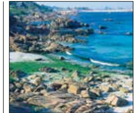
חוף פיניסטרָה, גאליסיה

נופש סולידיים ונוף מרהיב. בפנים הארץ תגלו גבעות, כרי דשא, יערות, מנזרים ועיירות עתיקות ונאות – שם נדמה שהזמן עצר מלכת, ותוכלו להתרחק ממסלול התיירים השחוק.