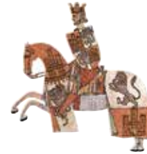
המלך אלפונסו העשירי, 'החכם'