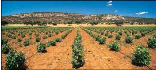
כרמים בלה מאנצ'ה, אזור הכרמים הגדול בעולם