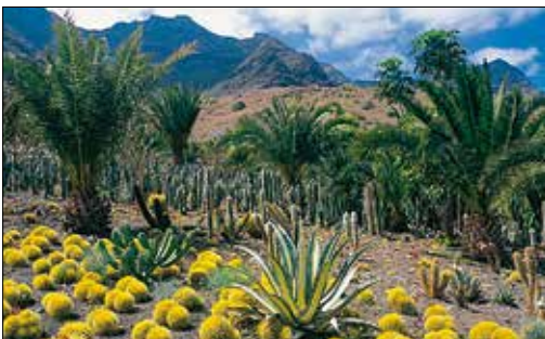
פארק קקטוסים בסן ניקולאס דה טולנטינו, גראן קאנאריה

הארכיפלאג היסטורית-כונני הזה, לחופיה המזרחיים של ספרד, משמש כבר שנים רבות מגרש משחקים ואתר נופש מהחשובים באירופה. אך נוסף לחופים ולבטינג, יש כאן גם הרבה מה לראות. מיורקה (ראו עמ' 21-514) הוא האי הגדול ביותר, ובו הרים מרשימים, מערות וקתדרלה גותית נפלאה