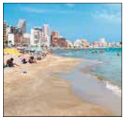
קטע של חוף זהוב בקאפל, קוסטה בלאנקה

שלה. קוסטה בלאנקה הוא קו חוף פופולרי מאוד, ובו מבחר של אתרי נופש – מבנידרום התוססת (ראו עמ' 260) ועד צ'אביה הסולידית (ראו עמ' 255). מחוז מורסיה מתאפיין באדריכלות הבארוק ובלגונת החוף מאר מְנור (ראו עמ' 262). בשני המחוזות תוכלו להשתתף בפסטיבלים מרהיבים, בהם גם פסטיבל לאס פאליאס התוסס ב וואלנסיה (ראו עמ' 255).