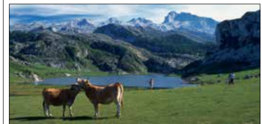
פארקה נאסיונאל דה לוס פיקוס דה אַרוֹפָה, קנטבריה

הפינה הצפון-מערבית של ספרד היא הגשומה ביותר במדינה, ולכן גם הירוקה ביותר. מדי שנה מבקרים, המוני עולי-רגל ב סנטיאגו דה קומפוסטלה (ראו עמ' 93-90). עיר מימי-הביניים שהיא יעדו הסופי של מסע צליינות, ובנויה סביב קתדרלה מעוררת השראה. מוקד עניין חשוב לא פחות הוא קו החוף הארוך והמחורץ. אחד ממקטעי, ריאס באישאס (ראו עמ' 95), מאופיין בשילוב המשולש בין חופי רחצה, אתרי