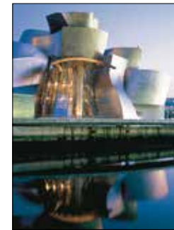
חזית הטיטאניום עוצרת הנשימה של מוזיאון גוגנהיים, בילבאו

שני אזורים אלה מרכיבים יחדיו את חלקו המרכזי של החוף הצפוני הירוק והפורח. שניהם מתאפיינים בגבעות הגולשות אל קו החוף המשתפל, ובו מפרצים יפים וחופי רחצה טובים. שני האזורים חולקים ביניהם את רכס ההרים הנגיש ביותר בספרד, פיקוס דה אַרוֹפָה (ראו עמ' 9-108), לשם נוהרים מיטיבי הלכת בזכות הגאיות, הערוצים והפסגות. חבל הארץ רווי בפרהיסטוריה ובהיסטוריה. מבין אינספור המערות המקושטות בציורי-קיר קדומים, הידועות ביותר הן מערות אַלטאמירָה (ראו עמ'