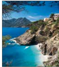
קובס ד'ארטה, מיורקה

בבירה פלמה (ראו עמ' 1-520). לאיביזה (ראו עמ' 2-510) יצאו מוניטין של אי שכולו מסיבות פרועות וחיי לילה, אך יש באי גם מפרצונים מבודדים ואזור כפרי שליו המשופץ כולו בכפרים יפים. מנורקה (ראו עמ' 3-522) מתגאה באתרים פרהיסטוריים, בעיירות קטנות ונאות ובפיסיטה מרשימה של רכיבה על סוסים (ראו עמ' 523).